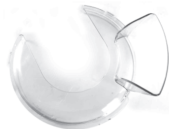
Крышка с загрузочной горловиной