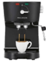
Кофеварки и кофемашины